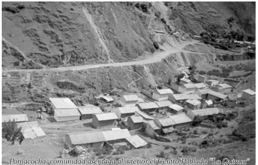
Pomacocha, comunidad asentada al interior el Centro Poblado “La Quinua”

La vestimenta del poblador antiguo consistía en el caso del varón, en un pantalón “cordillate” (de lana resistente), chaleco, el chullo, medias de lana y el “shucuy” (sandalias del pellejo de carnero y llama); la mujer vestía con una cata (manto), la pollera de colores múltiples, el sombrero de paja, el mantón, la sandalia o también el “shucuy”.