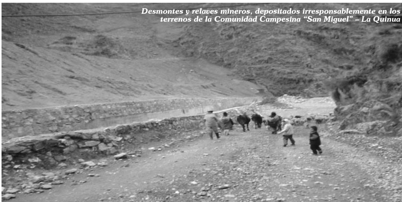
Desmontes y relaves mineros, depositados irresponsablemente en los terrenos de la Comunidad Campesina “San Miguel” – La Quinua