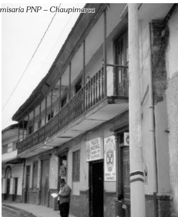
Comisaría PNP – Chaupimarca