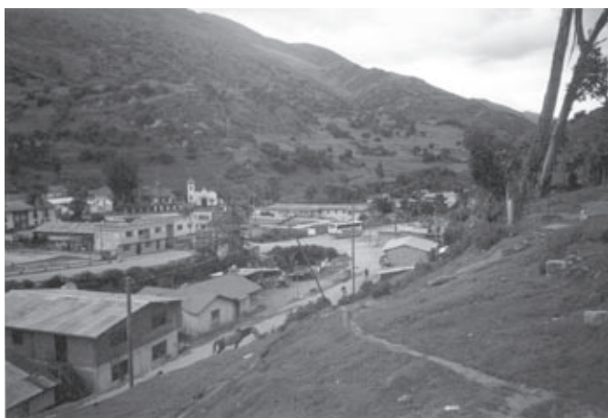
Comunidad Campesina “La Quinua”

La Quinua está ubicada en la parte alta de las cuencas del río Huallaga y Huanca, a 30 minutos de la ciudad del Cerro de Pasco, en plena carretera central; clima templado a una altura de 3,600 m.s.n.m. Pertenece al distrito de Yanacancha, provincia y departamento de Pasco. Está rodeado de montañas y quebradas, con campos en las laderas; la vegetación dominante es de tipo pajonal, existen rodales de árboles muy hermosos, propio de la zona alto andina del país como es el “Queñoa”, única formación boscosa nativa de la región.