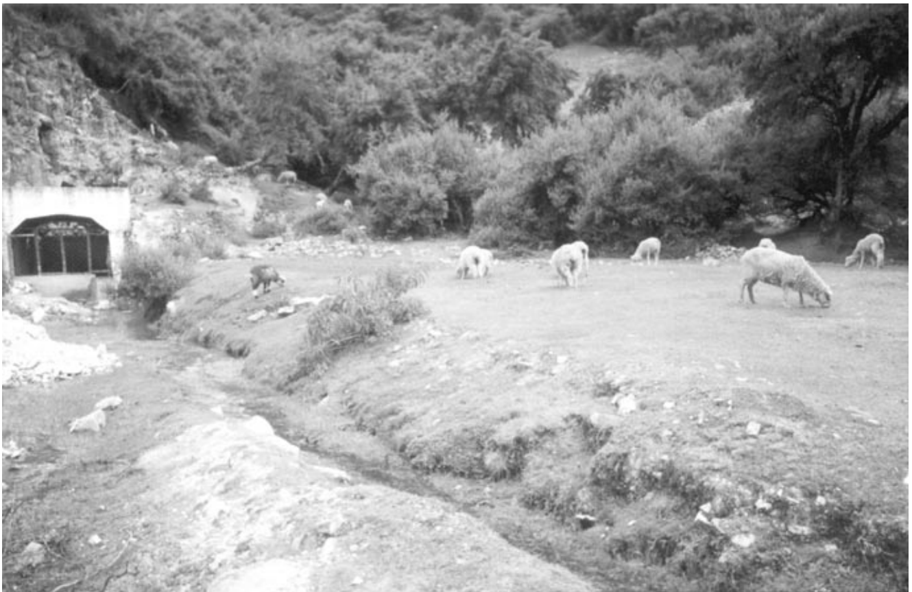
Bosque de Quinuales – Pasco.

normas legales ambientales y los derechos de las comunidades; a las empresas mineras decirles que no estamos en contra de las operaciones mineras porque también aportan a la economía del país, pero sí le solicitamos que sus diversas operaciones lo realicen con mucha responsabilidad ambiental y social, remediando todos sus pasivos ambientales. Con las comunidades campesinas, se requiere negociaciones transparentes, que no perjudiquen el accionar de ambos actores y se obtenga beneficio mutuo; todo ello en favor de las generaciones futuras y que no solamente ganen los poderosos de las empresas, enriqueciéndose con los recursos existentes a costa de las comunidades campesinas donde hay muchas necesidades; de continuar así, la tierra llegará a ser estéril y tampoco habrá agua para la vida.